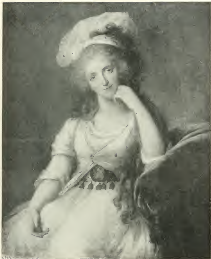
MADAME MARIE-ADÉLAÏDE DE BOURBON, DUCHESSE D'ORLÉANS (1753-1821)